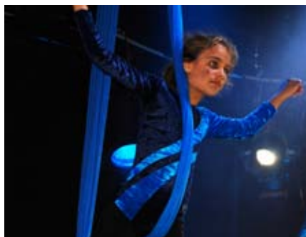
akrobatisk: Kulturskoleelever fra Fredrikstad viste kunster høyt til vær.