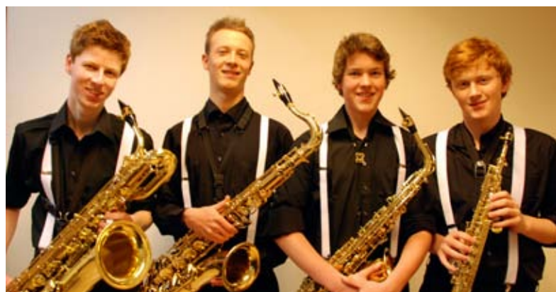
kule gutter: saxofonkvartetten Broken Reed fra Bergen og Askøy.