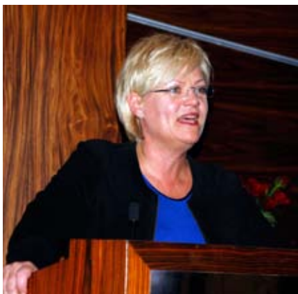
positivt mottatt: Statsråd Kristin Halvorsen holdt en tale som falt i smak hos mange.