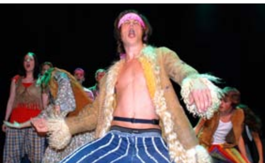
ga alt: Musikkalevene fra Moss viste utdrag fra "Hair".