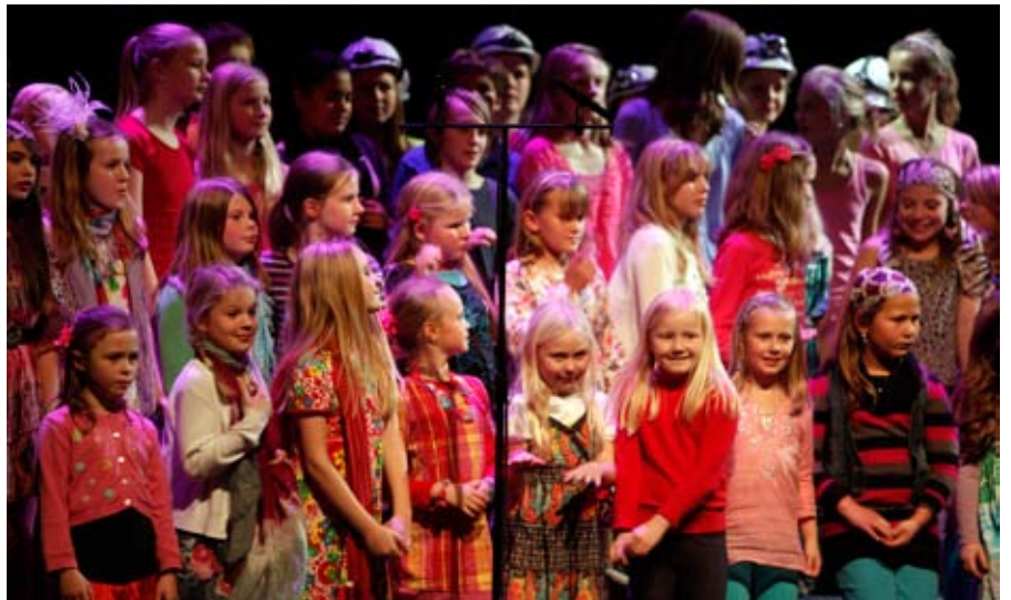
jubileumssang: Unge korsangere på scenen i Bærum kulturhus.

Musikk- og kulturskolen i Bærum teller i dag 1800 elever og 83 lærere. Skolen har vært en ren musikk-skole frem til det kom et billedkunsttilbud i fjor. – Årsaken til at vi ikke har satset på et bredere fagtilbud er at det i Bærum allerede finnes et veletablert og godt teater- og dansetilbud drevet av private aktører. Vi ser ingen grunn til å konkurrere med disse som vi har et nært og godt samarbeid med, sier Fuglseth.