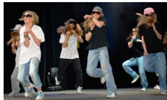
østfoldhiphop: "Teenagers with Attitude" i festlige festkveldsrytmer.