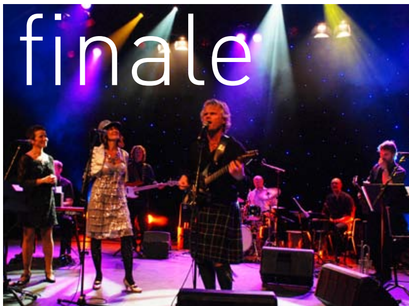
62 breddegrad: KOM! Trøndelags "eget band" spilte opp til både allsang og dans.